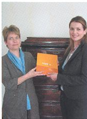
April 2006 Hollywoodstar Julia Ormond besucht SOPHIE.