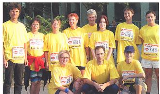
September 2003 Die Volkshilfe Wien beim Business-Run.