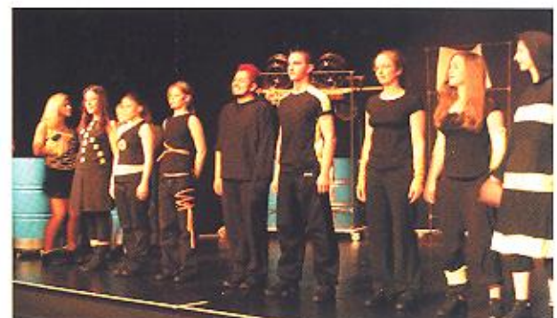
Juni 2006 hipopera feiert seine erste Premiere.