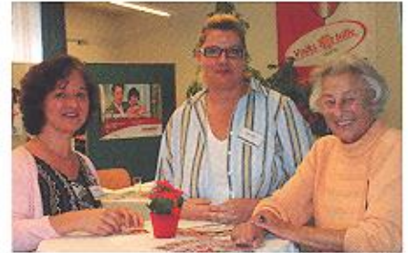
September 2005 Buntes Treiben beim Tag der offenen Tür in der Zentrale.