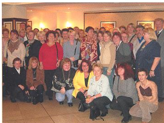
November 2003 Die Volkshilfe Wien ehrt langjährige MitarbeiterInnen.